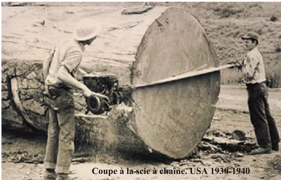
Coupe à la scie à chaîne. USA 1930-1940